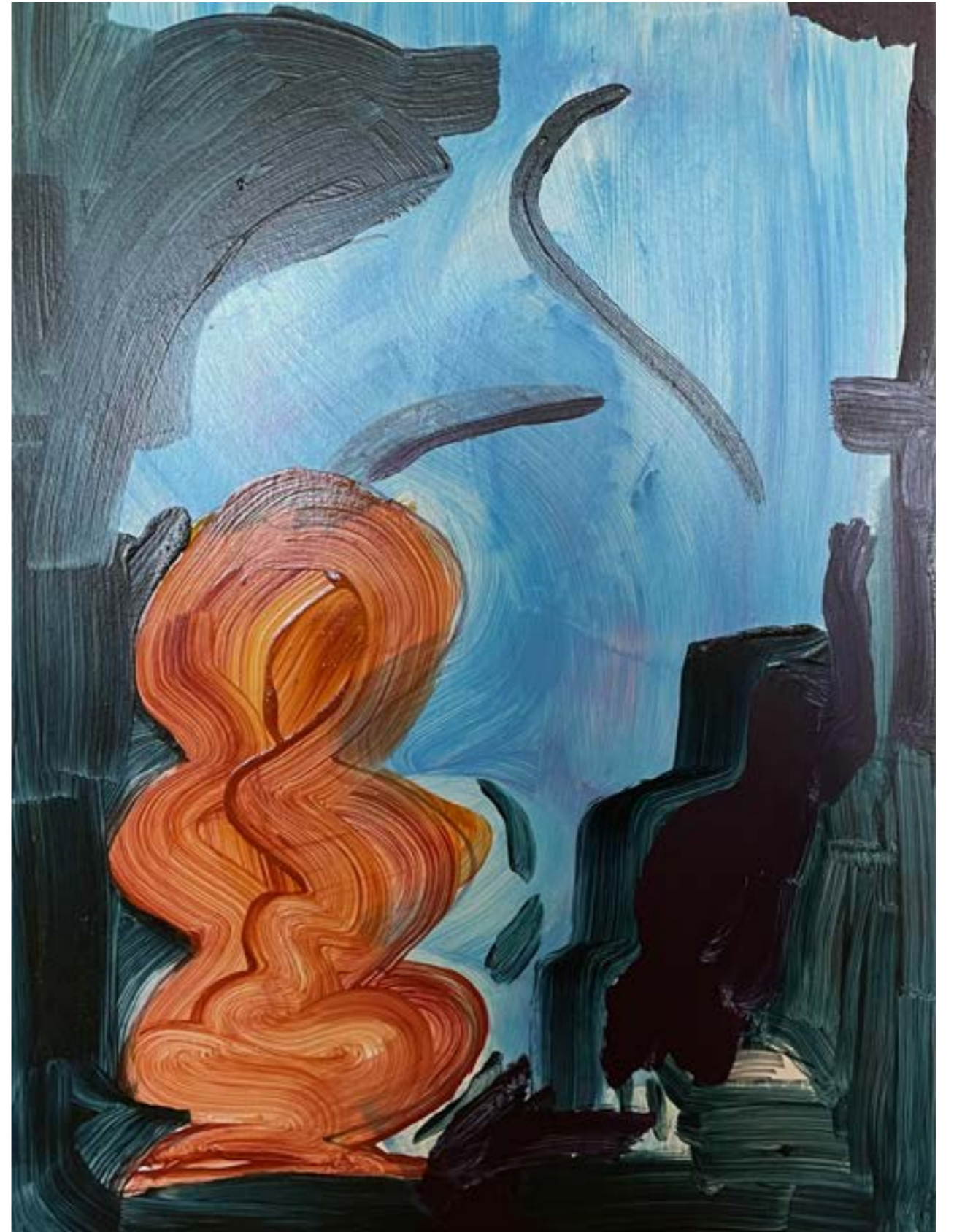
above & right: « À deux pas du silence », 2021, acrylique sur carton bois, 100x70 cm « À deux pas du silence », 2021, acrylic on wood cardboard, 100x70 cm