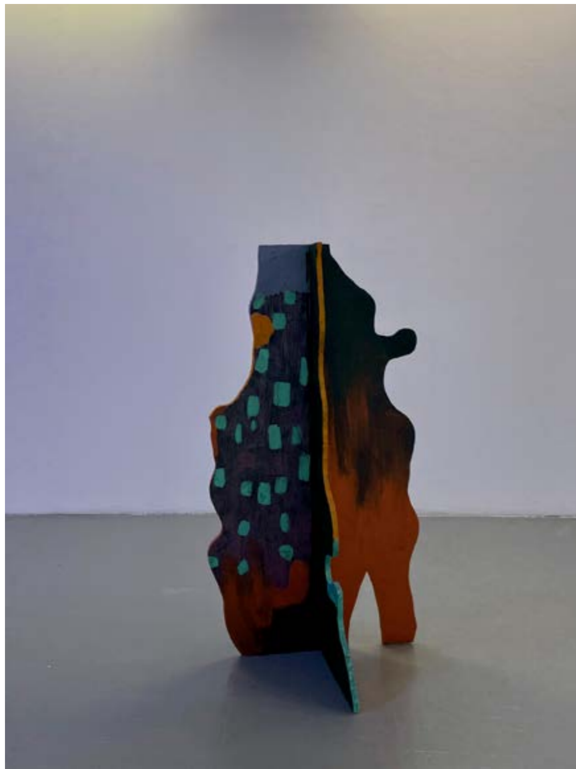
above: « Quand le soleil s'éteint », 2018, acrylique sur bois, 140x50x60 cm « Quand le soleil s'éteint », 2018, acrylic on wood , 140x50x60 cm