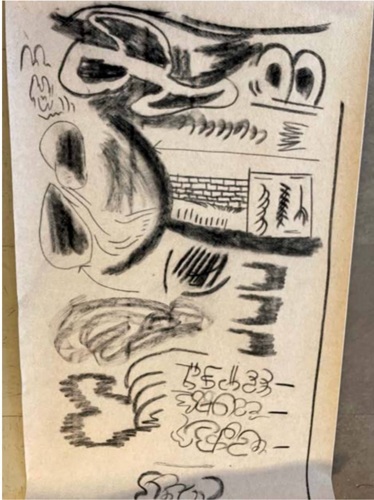
above: « Chronique d'une journée ordinaire », 2019, fusain sur moquette, 220x90 cm « Chronique d'une journée ordinaire », 2019, charcoal on carpet, 220x90 cm