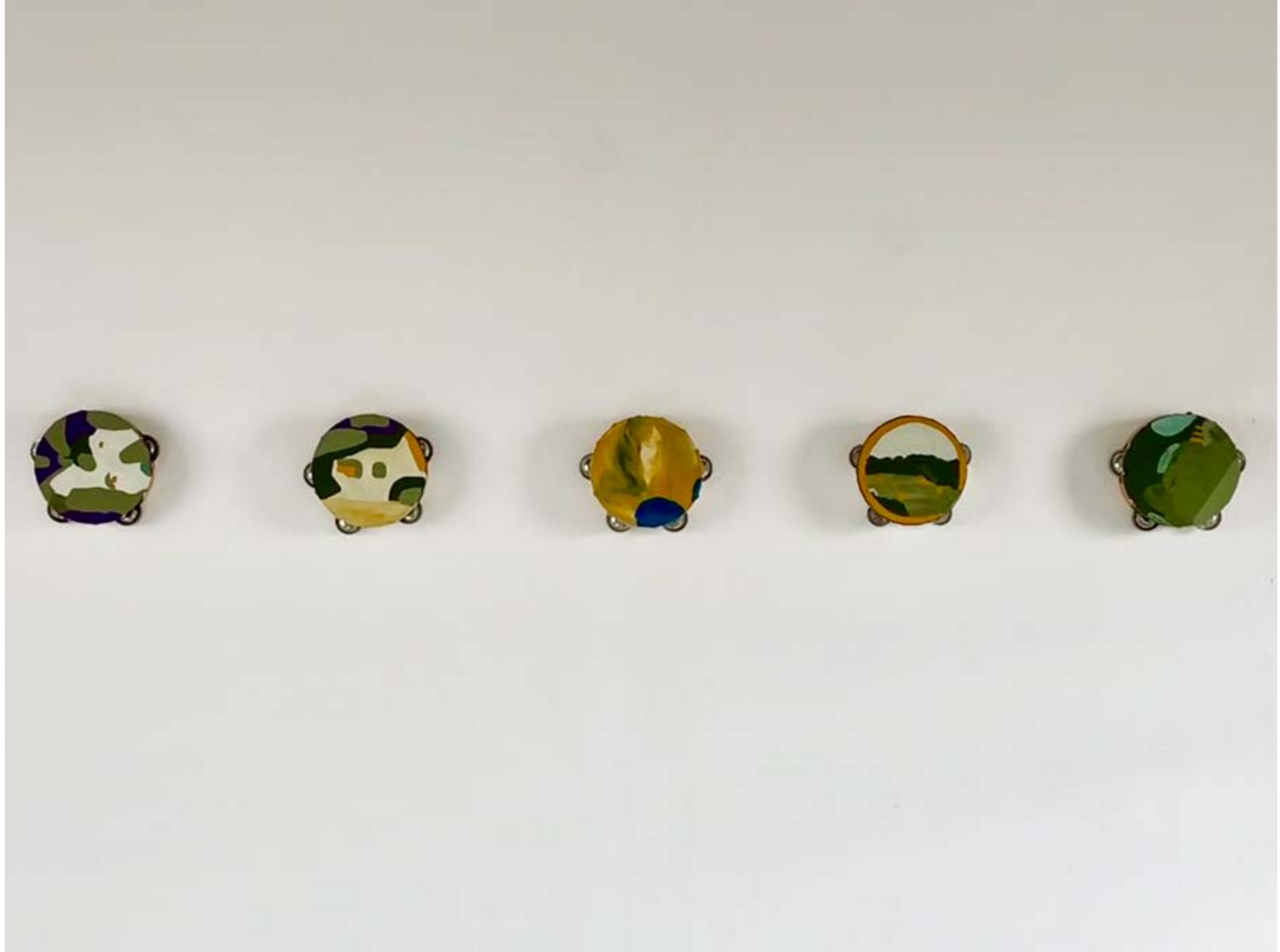
above: « À deux pas du silence », 2021, peinture vinyl sur tambourins, diametre 20 cm (chaque) « À deux pas du silence », 2021, vinyl paint on tambourines, diameter 20 cm (each)