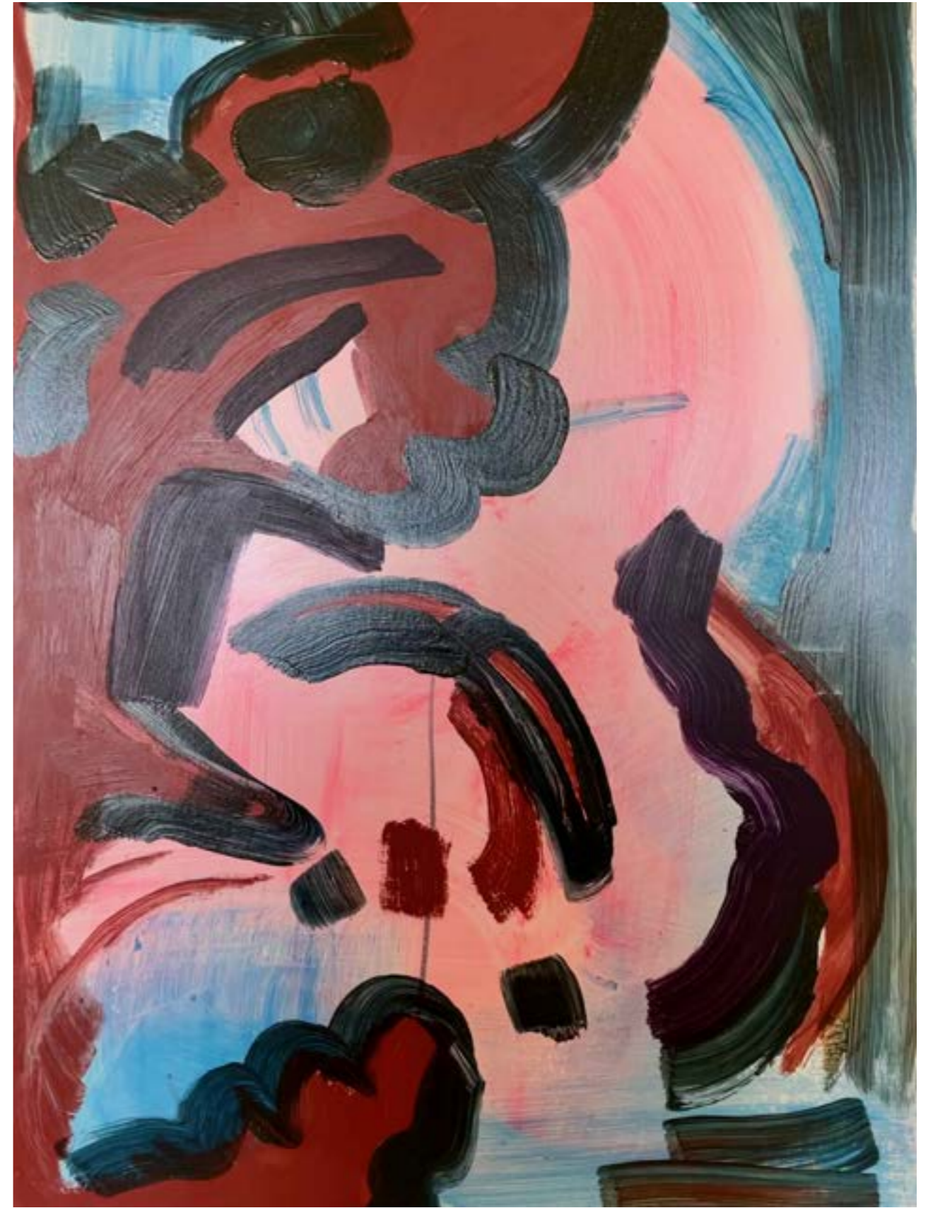
above: « À deux pas du silence », 2021, acrylique sur carton bois, 100x70 cm « À deux pas du silence », 2021, acrylic on wood cardboard, 100x70 cm