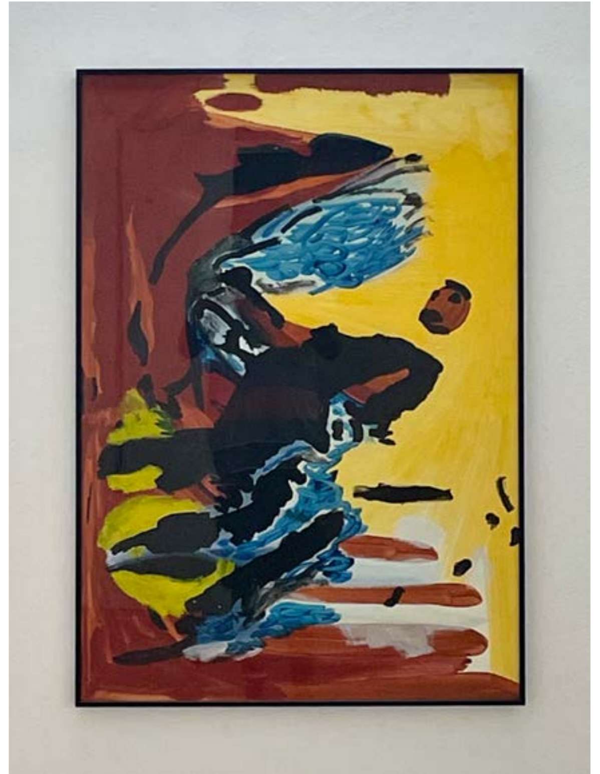
left & above: « À deux pas du silence », 2021, acrylique sur carton bois, 100x70 cm « À deux pas du silence », 2021, acrylic on wood cardboard, 100x70 cm