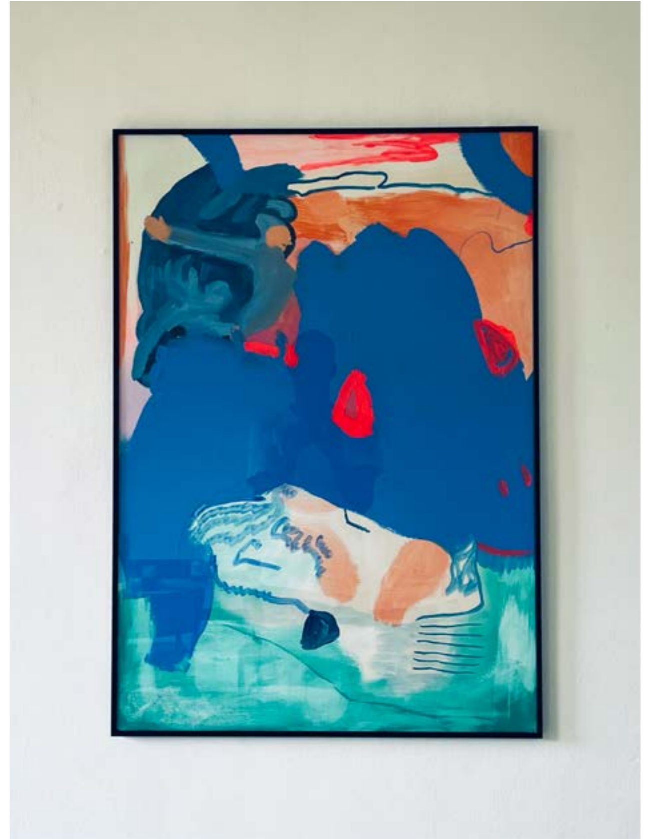
above: « À deux pas du silence », 2021, acrylique sur carton bois, 100x70 cm « À deux pas du silence », 2021, acrylic on wood cardboard, 100x70 cm