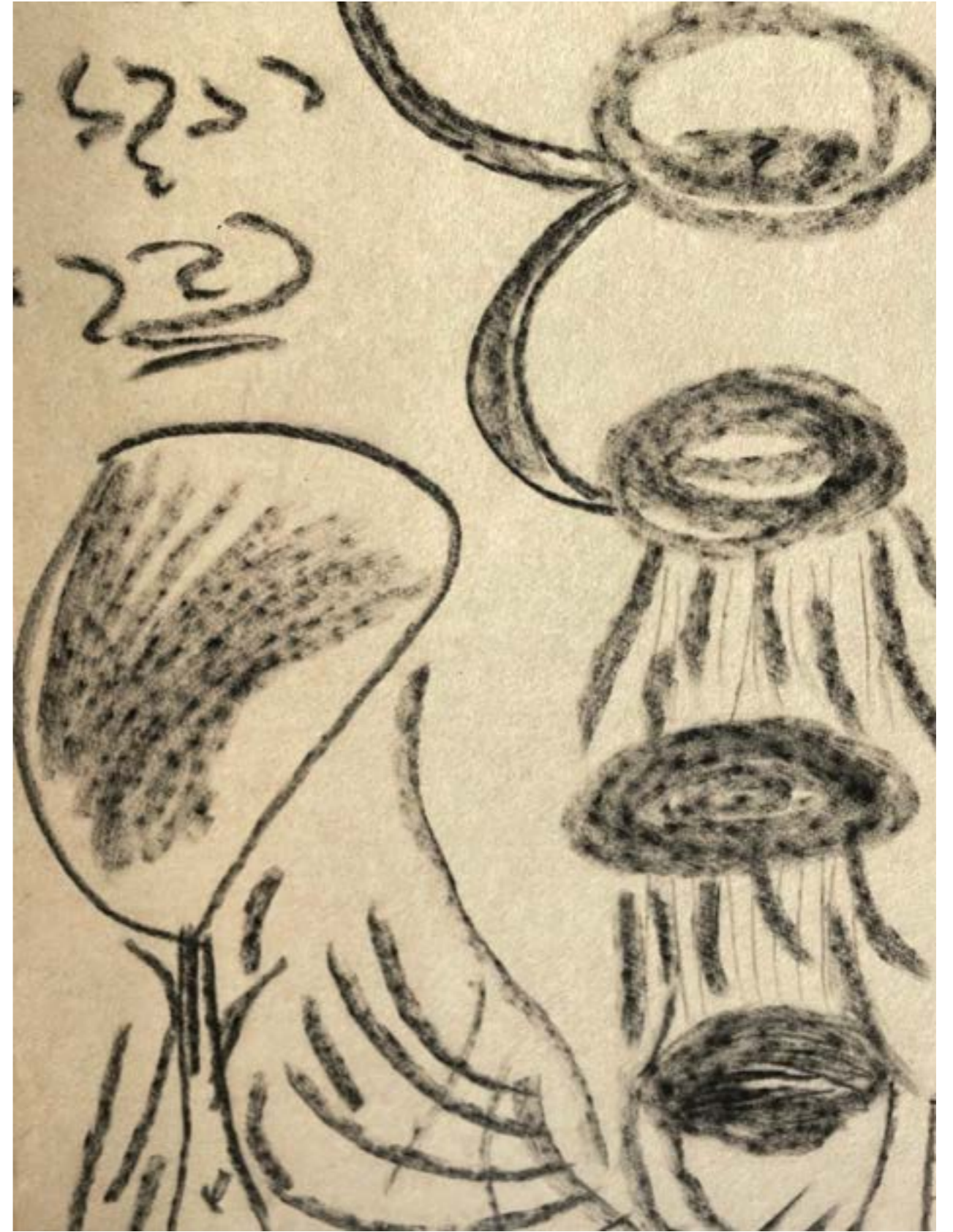
above: « Chronique d'une journée ordinaire » détail, 2019, fusain sur moquette, 220x90 cm « Chronique d'une journée ordinaire » détail, 2019, charcoal on carpet, 220x90 cm