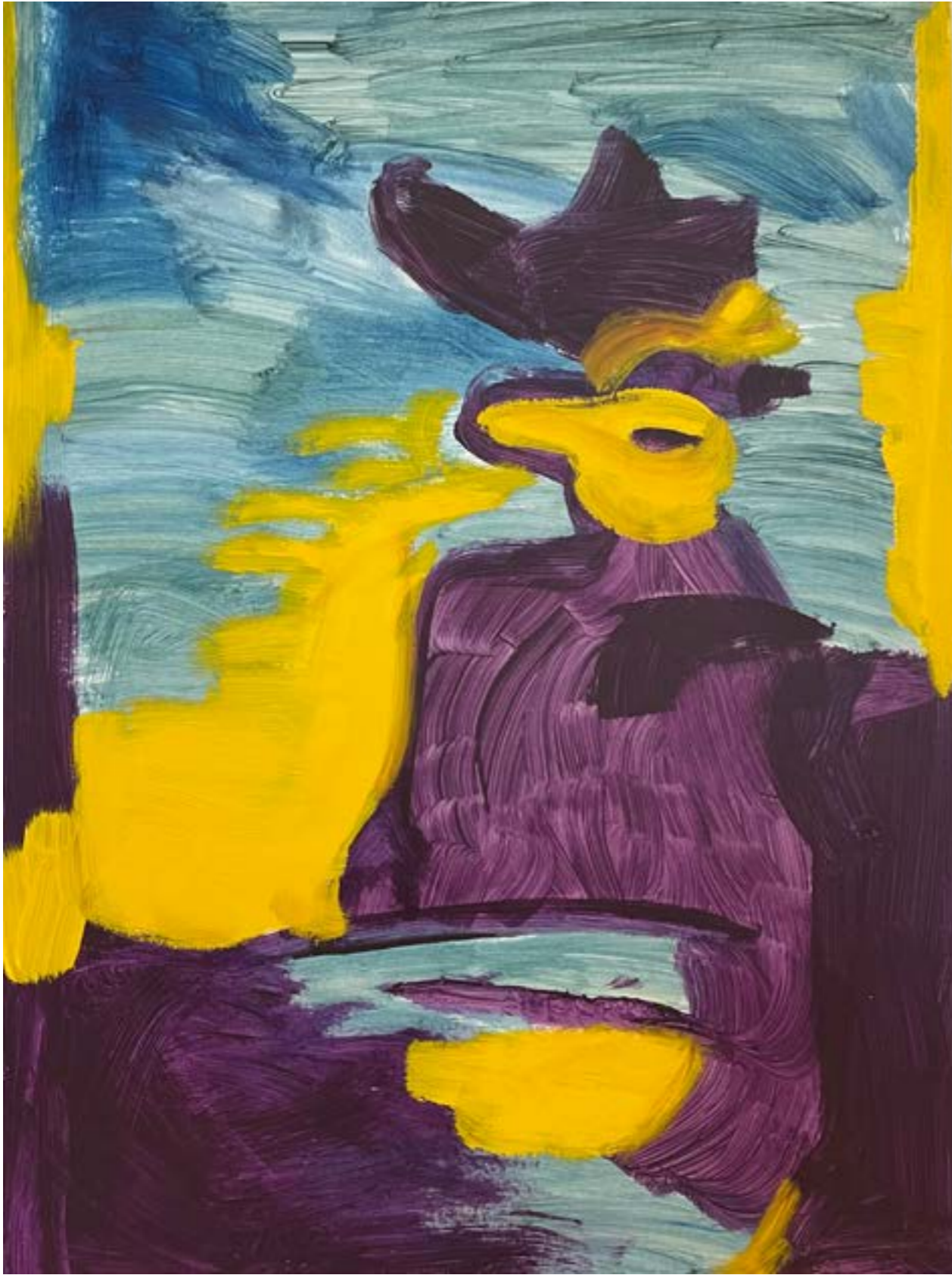
above: « À deux pas du silence », 2021, acrylique sur carton bois, 100x70 cm « À deux pas du silence », 2021, acrylic on wood cardboard, 100x70 cm