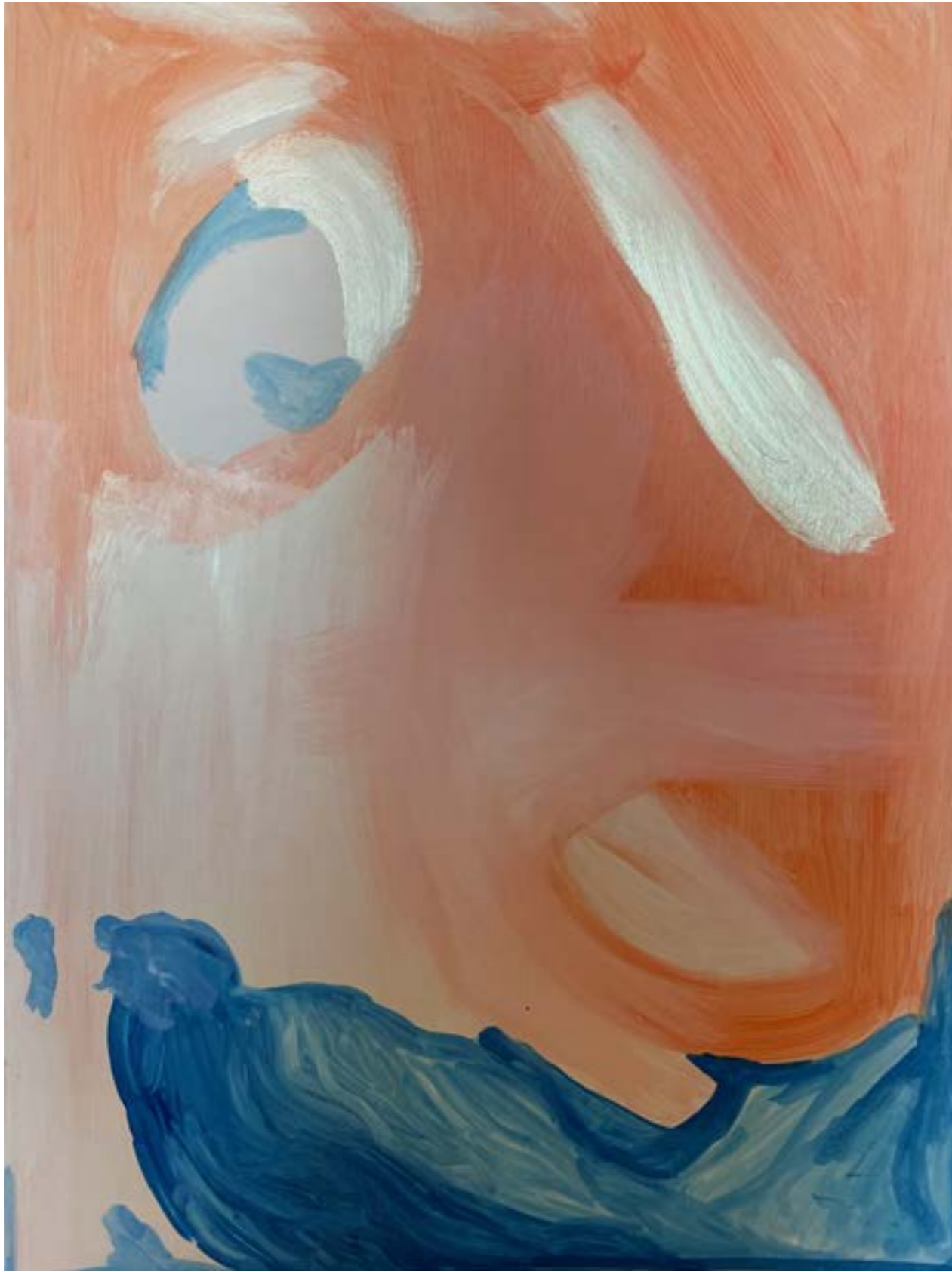
above: « À deux pas du silence », 2021, acrylique sur carton bois, 100x70 cm « À deux pas du silence », 2021, acrylic on wood cardboard, 100x70 cm