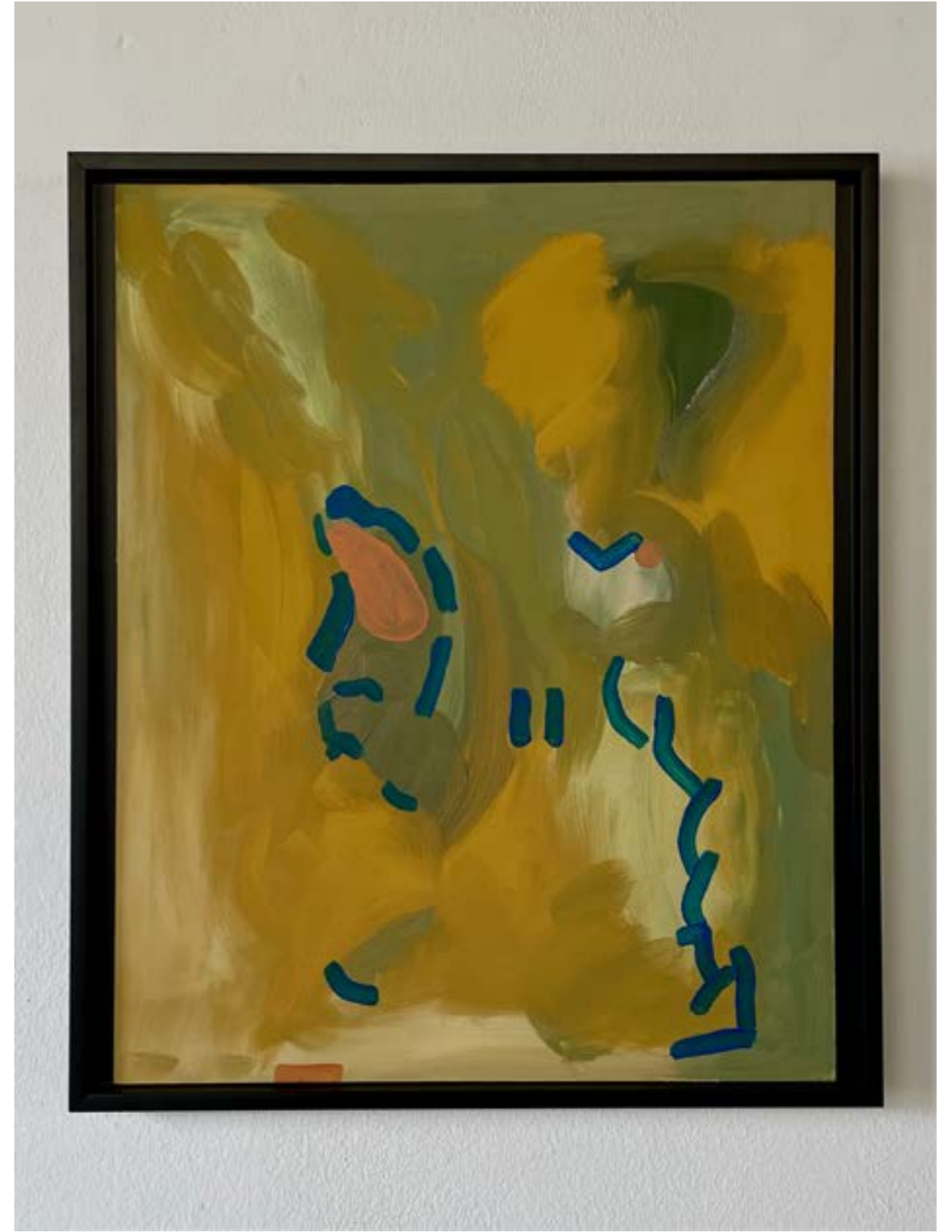
above: « Two Beat », 2021, pigments, liant, acrylique sur carton bois, 60x40 cm « Two Beat », 2021, pigments, binder, acrylic on wood cardboard, 60x40 cm