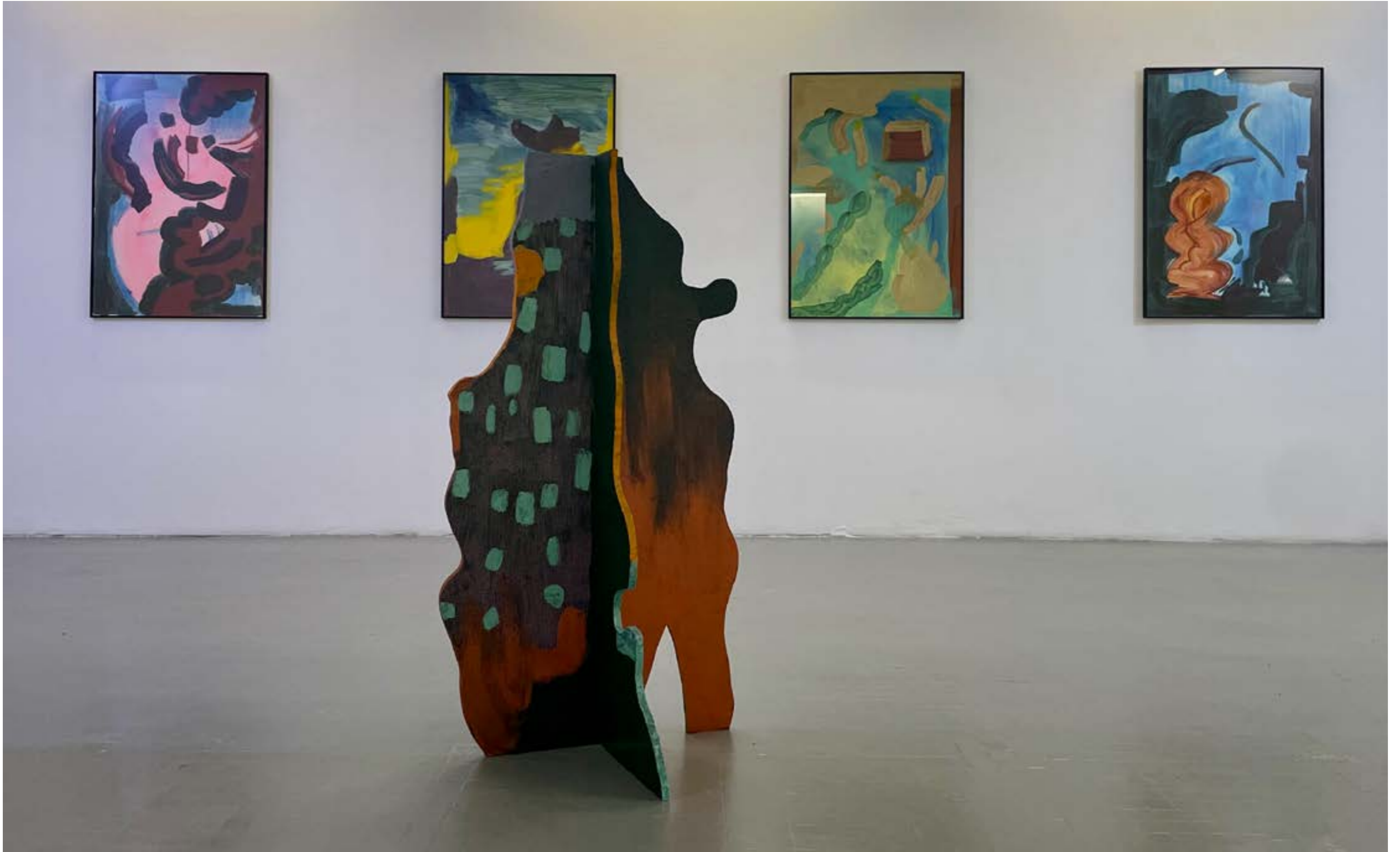
above: « À deux pas du silence », 2021, vue d'expo « À deux pas du silence », 2021, exhibition view