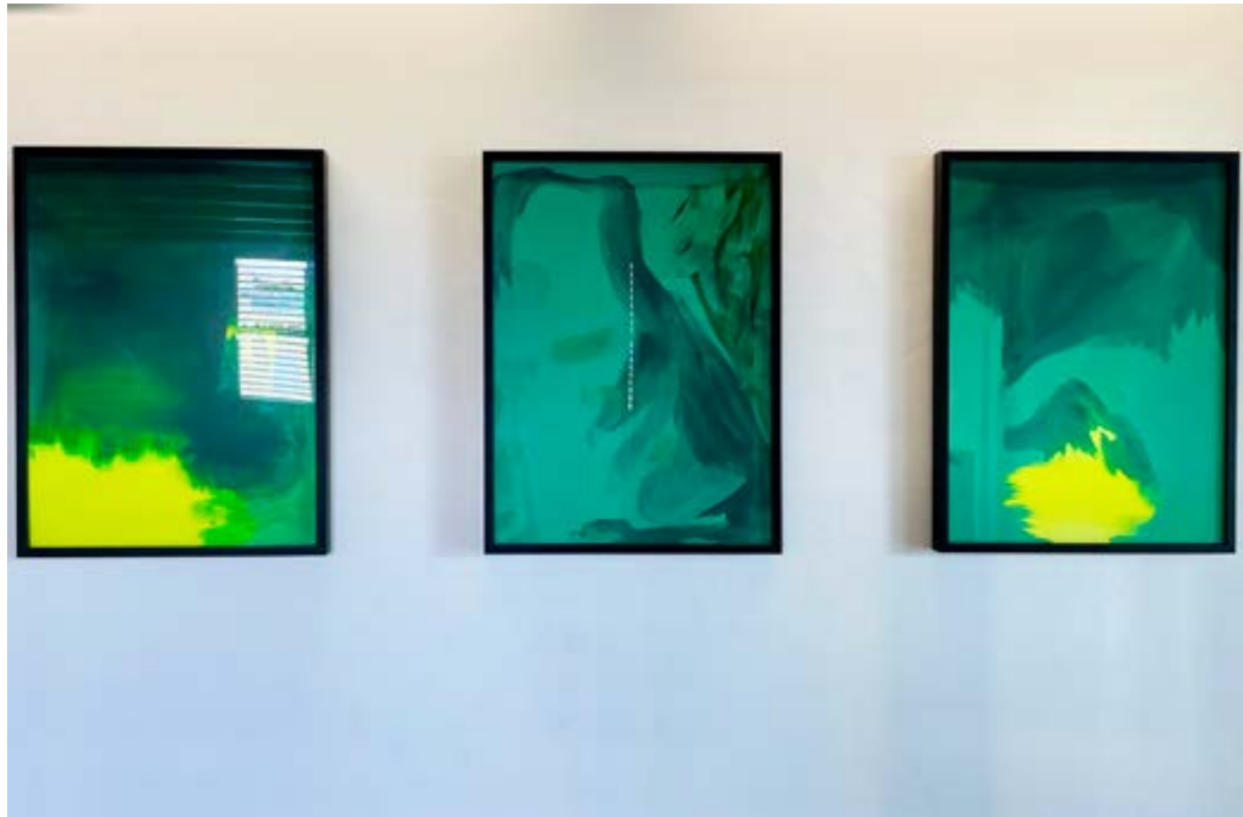
above: « Backbeat » (Triptyque), 2021, peinture vinyl sur carton bois, 80x60 cm (chaque) « Backbeat » (Triptyque), 2021 vinyl paint on cardboard wood, 80x60 cm (each)