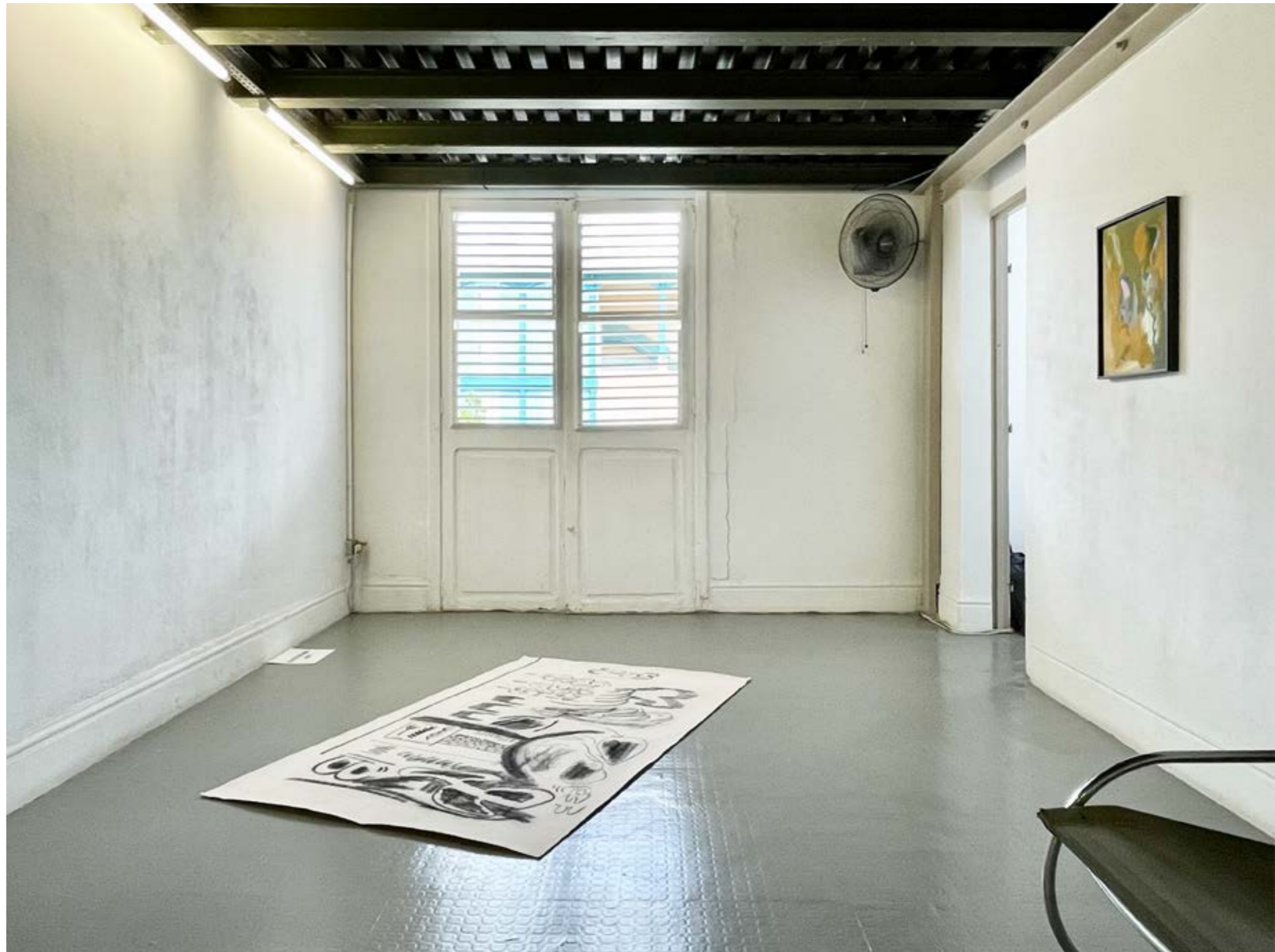
above: « À deux pas du silence », 2021, vue d'expo « À deux pas du silence », 2021, exhibition view