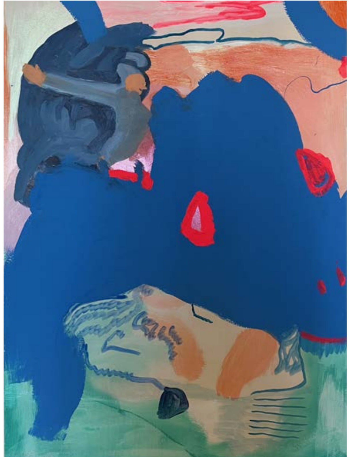
above: « À deux pas du silence », 2021, acrylique sur carton bois, 100x70 cm « À deux pas du silence », 2021, acrylic on wood cardboard, 100x70 cm

Sharjah Foundation, Qatar Frac PACA, France Frac Pays de Loire, France Private collections (USA, France, UK, Martinique)